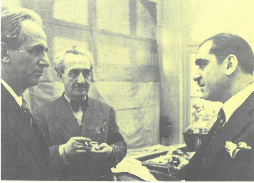
Fotoğraf 7. Ünlü ressamlar Çallı İbrahim ile Feyhaman Duran ve Yücel