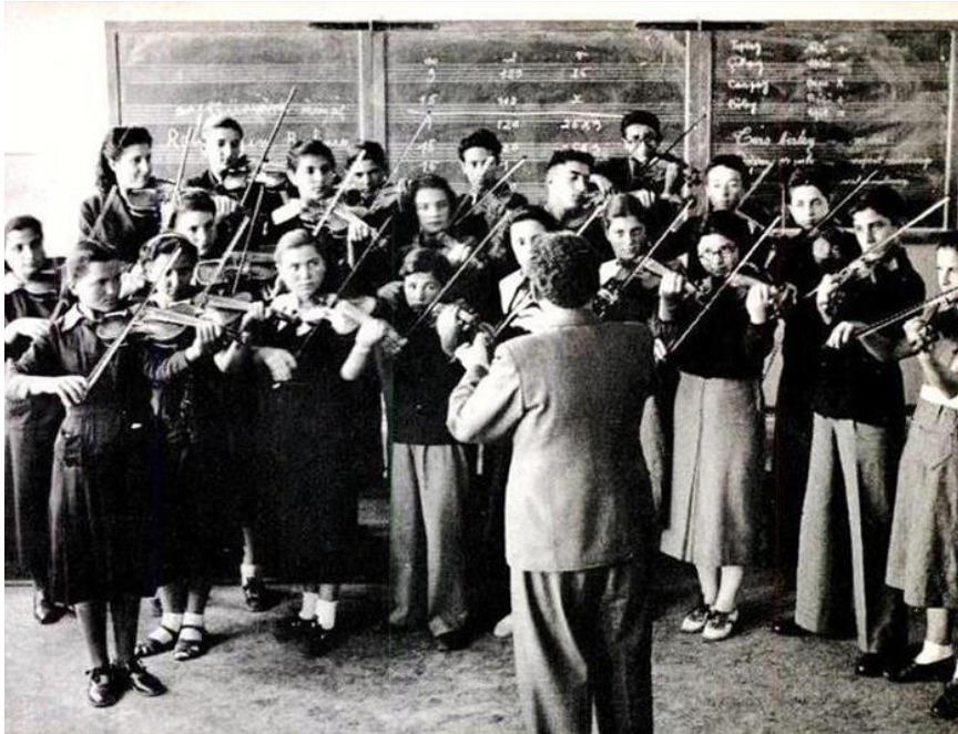
Fotoğraf 4. Öğrencilerin kendi elleriyle yaptıkları müzik aletleri ve enstitüde müzik dersi.

Köy Enstitüsü programlarında, sanat eğitiminin çok önemli bir yer tuttuğu görülür. Bu anlayışı, Köy Enstitülerinde okuyan öğrenciler arasından, sanatın çeşitli dallarında çok önemli ürünler veren birçok sanatçının yetişmesini sağlar ve sanat kültürünü çok iyi almış, benimsemiş yaratıcı ve üretken eğitimciler yetiştirilir (Altunkaya, 2002).